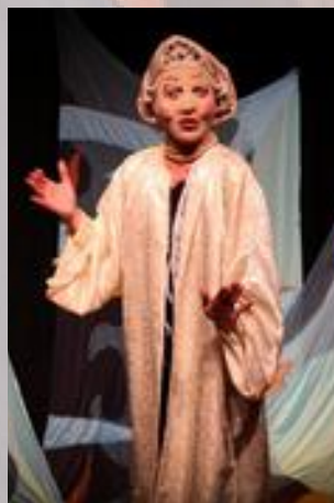
La mère du prince