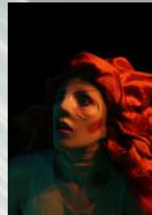
La petite sirène