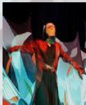
Le roi du monde marin