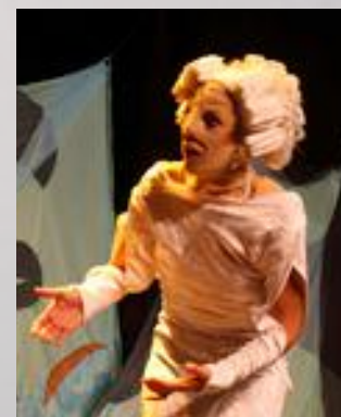
La princesse du royaume voisin