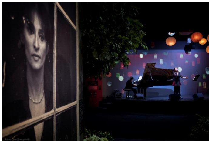
(Concert à la Philharmonie / Exposition Barbara)