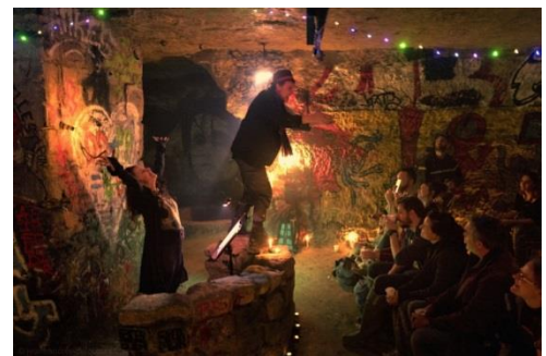
Dans les carrières sous Paris / juin 2017