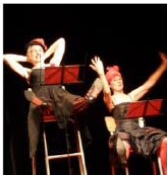
Le duo de comédiennes a amusé le public.

La compagnie A vol d'oiseau a présenté l'autre soir un spectacle intitulé Les règles du savoir-vivre dans la société moderne de Jean-Luc Lagarce dans la salle du cinéma d'Orbey. Les deux comédiennes ont livré ces « règles du savoir-vivre » avec ironie, autorité, gourmandise, tendresse. Elles parlent, chantent et rient. Leur gestuelle précise et chorégraphiée, rythme le texte de manière inattendue. Une belle soirée pleine de bonne humeur.