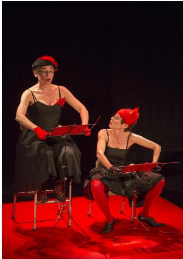
Le spectacle s'inscrivait dans le cadre des 25 ans des « Régionales » de l'agence culturelle d'Alsace.

Un spectacle burlesque ce mardi soir, fait de tendre ironie, ponctué de rires homériques, cristallins. Un spectacle présenté avec brio, un brio à vous couper le souffle. Histoire d'un gosse qui s'était donné la peine de vivre, a été baptisé avec obligation d'avoir parrain et marraine et tout le tremblement, des « obligations » qui se succèdent jusqu'au trépas, en passant par l'adolescence, l'âge de prendre épouse (ou mari, selon le sexe...), le repas de noces (pour les deux sexes...). Une existence, dans ce domaine, bien remplie ! Une vie, en effet, bourrée de