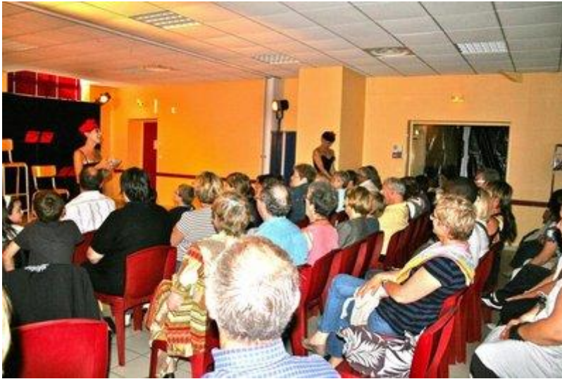
Un spectacle insolite par la compagnie A vol d'oiseau.

Le succès était au rendez-vous à Tauxières-Mutry, jeudi soir, pour l'avant-dernière représentation organisée par la MJC intercommunale d'Aÿ « Les règles du savoir vivre dans la société moderne », pièce interprétée par deux artistes burlesques de la compagnie A vol d'oiseau.