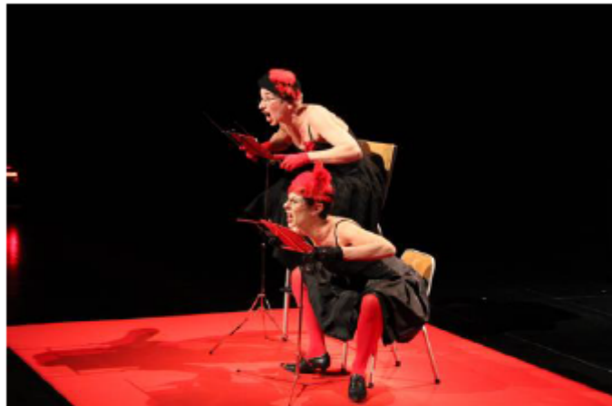
Des actrices, comédiennes, et chanteuses hors pair.