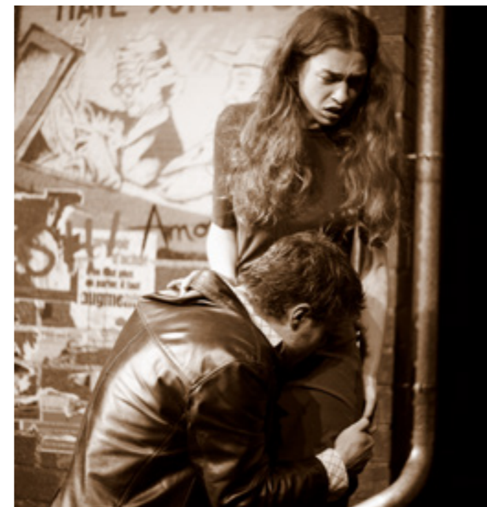
LES CAPRICES DE MARIANNE

Fondé en 2013, le Mireno Théâtre est né de la volonté d'un groupe d'artistes désireux de défendre le théâtre de répertoire. Un répertoire large, qui couvrirait autant la tragédie antique que le théâtre de l'absurde. Un répertoire populaire, dans le sens où il générerait une émotion profonde, mais ambitieux dans son exploration de sujets complexes, peut-être déroutants, en tous cas porteurs d'une réflexion. Un répertoire qu'on aborderait, avec notre regard contemporain, sous l'angle du rapport à l'autre.