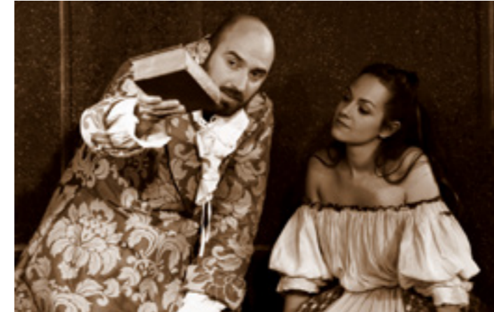
LA SECONDE SURPRISE DE L'AMOUR